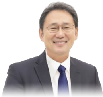
성신여자대학교 총장 이 성근 이 성근

지금의 미결정이 혼란스럽겠지만, 그 혼란이 기웃거림에 의해 여러분들을 건강한 사람으로 만들 것입니다.