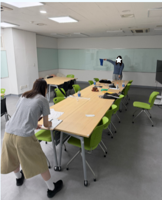
영단어 맞추기 미션

세마포어(Semaphore) 깃발을 활용한 영어 미션 활동을 진행하였다. 짝과 일정 거리에서 깃발 신호로 알파벳을 전달하며 영어 단어를 완성하는 미션을 수행하였다. 활동 과정에서 의사소통 능력을 자연스럽게 익힐 수 있었으며, 신체 활동과 게임 요소를 접목하여 흥미로운 체험형 영어 프로그램이 운영되었다.